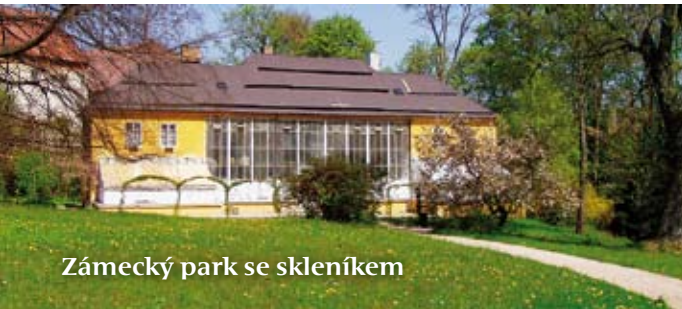
Zámecký park se skleníkem

Ratibořický zámek postavili na počátku 18. století Piccolominiové jako barokní budovu, adaptaci zámku na empírové letní sídlo realizovala Kateřina Zaháňská o století později.